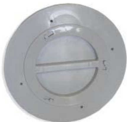
Fali adapter zárósapkával

Beltéri elhelyezésnél az opcióként kapható, zárósapkával ellátott falba/üvegbe építhető átvezető adaptert akár több helyiségbe beépítve a mobil klíma a guruló lábain abba a helyiségbe tolható, amelyik helyiséget épp hűteni/fűteni szeretnénk.