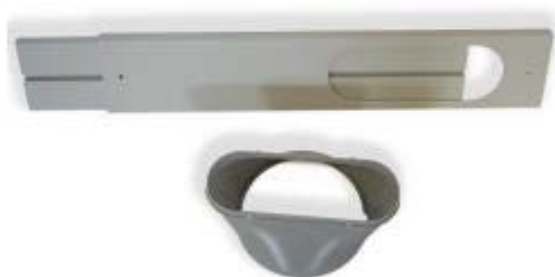
Kifúvó idom tolóablakhoz